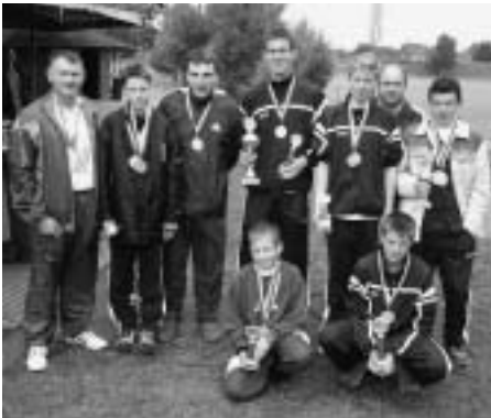
Die Sieger des LV-Turniers 2004 in Veenhusen.

Auch in diesem Jahr richtete der ASV Leer, Ortsgruppe Moormerland unsere Landesverbandsmeisterschaft im Castingsport aus. Die Veranstaltung fand auf den Sportplätzen von Fortuna Veenhusen statt.